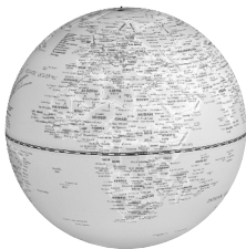
1x AtlasGlobe Lamp