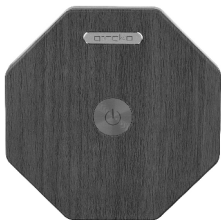
1x Twist Hexagon Lamp