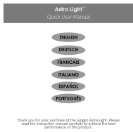
1x Instruction Manual Booklet