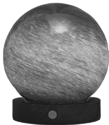
1x AstraGlass Light on Walnut Base